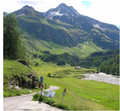
La strada chiusa al traffico che dal parcheggio conduce al lago di Cavloc in poco meno di un'ora.

> discesa: dalla vetta si scende su ripidi pendii in direzione sud ovest sino alla grande conca glaciale compresa tra il monte Sissone e la Cima di Rosso. Da qui si prosegue verso ovest scendendo lungo il ghiacciaio del monte Sissone (crepacci) fino a raggiungere nuovamente la vedretta del Forno, che si percorre in direzione nord ricongiungendosi così all'itinerario di salita.