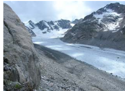
La vedretta del Forno salendo verso il rifugio. Sullo sfondo le cime che chiudono le valli di Zocca e Torrone.