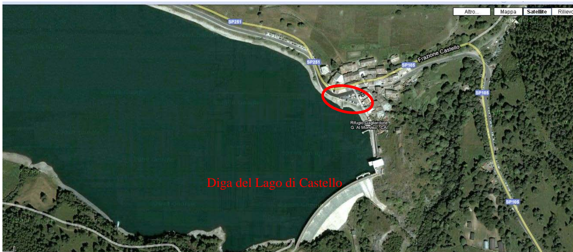
Diga del Lago di Castello

Per arrivare a Castello (Pontechianale – Val Varaita – CN)