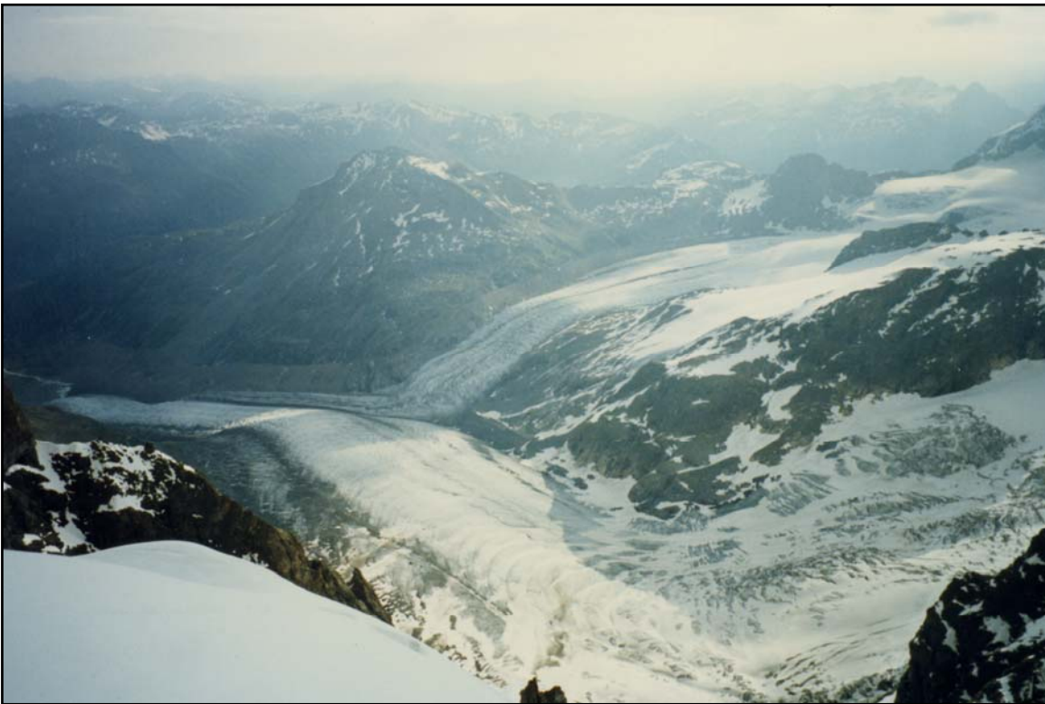
Nell'immagine, il ghiacciaio del Morteratsch visto dall'alto.