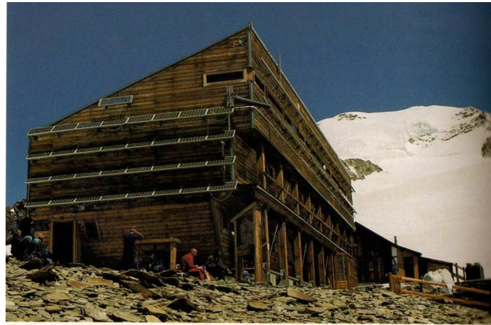
Il nuovo Rifugio Quintino Sella al Felik