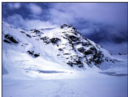
Com'era (direttore, parete N, luglio 1994)

Dislivello complessivo in salita della domenica: circa 1.260 m.