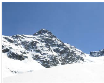
Com'era (Simone - maggio 2007)

Discesa: fare riferimento al proprio istruttore (l'itinerario sarà deciso in base ad esigenze logistiche).