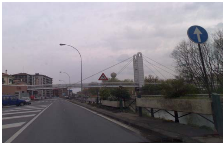
1 ponte ciclabile

Dopo il cartello "Corsico" proseguire lungo il naviglio e passare sotto il ponte ciclabile bianco, da lì imboccare la terza strada a sinistra, Via Armando Diaz (è la via prima del semaforo)