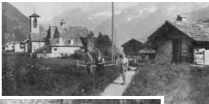
12 luglio 1925 Collage di alcuni scatti del passaggio a Macugnaga