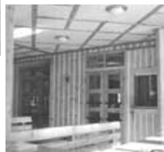
Immagini d'interni

Due sale, comprendenti anche una veranda con esposizione verso la parete est del Rosa, danno la possibilità di ospitare circa 90 persone ai tavoli, eseguiti in larice con piano ricoperto in Niplac; le pareti sono rivestite a liste verticali di pino cembro, intercalate da striscie di masonite verniciata in bianco; le panche sono fisse, esse pure in larice.