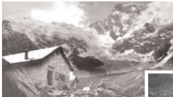
Sopra e a fianco: 20 settembre 1924, sotto : 12 luglio 1925

La "Capanna", ultimata alla fine dell'estate 1924, fu subito meta di una gita sociale per celebrare "...un voto compiuto...." nel quinto anniversario della scomparsa del compianto consocio, con "...un largo moto di simpatia.." verso quello che in sua memoria la SEM aveva concretizzato.