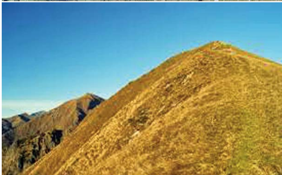
La Traccia - edizione speciale giugno 2018 - stampata in proprio